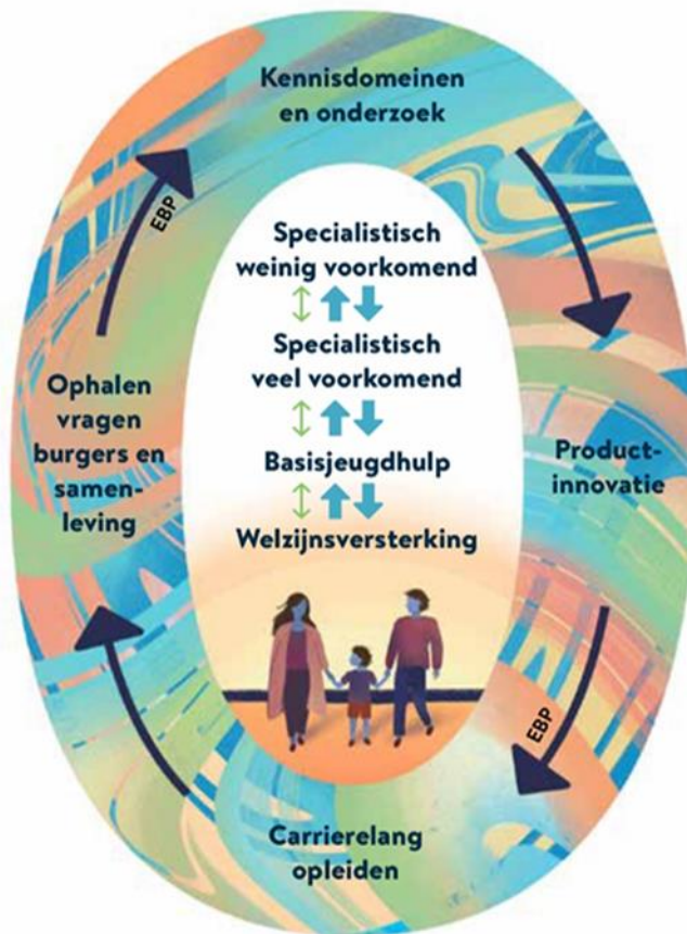
figuur: de Ontwikkelpijl